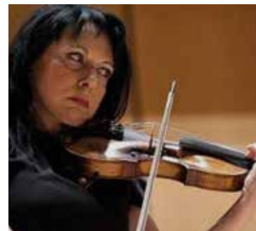
Silvia Marcovici Romania