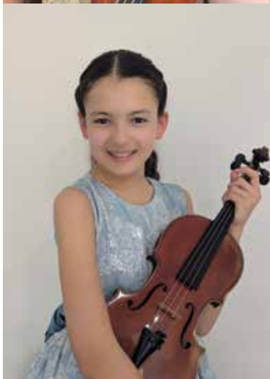
Lavorgna Sora 2013 – France